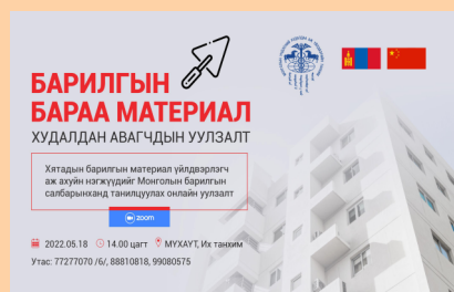
МОНГОЛ-ХЯТАДЫН БАРИЛГЫН САЛБАРЫНХАН ЦАХИМААР УУЛЗАВ