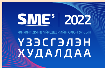
24 ДЭХ УДААГИЙН SME-2022” ОЛОН УЛСЫН ҮЗЭСГЭЛЭН ХУДАЛДАА БОЛЛОО