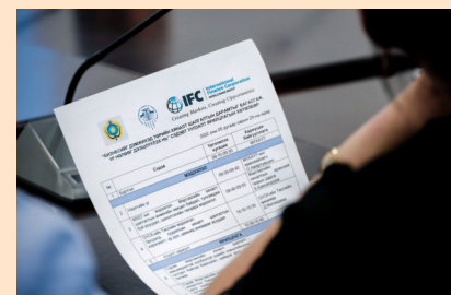
БИЗНЕСИЙГ ДЭМЖИХЭД ТӨРИЙН ХЯНАЛТ ШАЛГАЛТЫН ДАРАМТЫГ БАГАСГАЖ, ҮР НӨЛӨӨГ ДЭЭШЛҮҮЛЭХЭЭР ЗӨВЛӨЛДӨВ