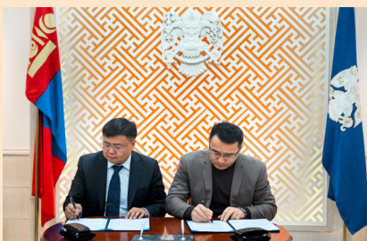
“КОВИДЫН ДАРААХ БИЗНЕСИЙГ ЭРЧИМЖҮҮЛЭХ МЕНЕЖМЕНТИЙН ХӨТӨЛБӨР” ОЛОН УЛСЫН СУРГАЛТ

2021 оны ТОП 100 ААН-ийн борлуулалтын орлогын хэмжээ өмнөх оноос 2.8 их наядаар өсч, 35.4 их наяд хүрсэн нь ДНБ-ий 82 хувьтай дүйцэж, ажиллагсдын тоо нь 8.3 мянгаар нэмэгдэж 99 мянгад хүрсэн нь нийт ажлын байрны 8.8 хувьтай тэнцэж байна. Эдийн засаг, бизнесээ сэргээхэд амаргүй жил байсан хэдий ч ТОП 100 ААН-ийн нийт төлсөн татварын хэмжээ өмнөх жилээс 26 хувиар өсч, 5.3 их наяд төгрөгт хүрлээ.