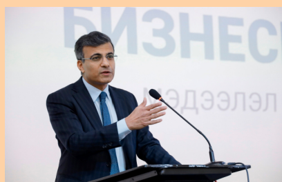
ДЭЛХИЙН БАНК, АЗИЙН ХӨГЖЛИЙН БАНКНЫ БИЗНЕСИЙН БОЛОМЖИЙН ТАЛААР БИЗНЕС ЭРХЛЭГЧДЭД ТАНИЛЦУУЛЛАА