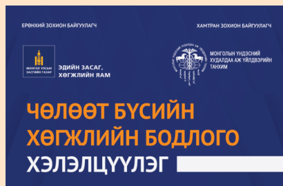
ЧӨЛӨӨТ БҮСИЙН ХӨГЖЛИЙН БОДЛОГЫН ТАЛААР ХЭЛЭЛЦЛЭЭ