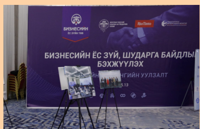
БИЗНЕСИЙН ЁС ЗҮЙ, ШУДАРГА БАЙДЛЫГ БЭХЖҮҮЛЭХ ТӨСЛИЙГ ҮРГЭЛЖЛҮҮЛЭН ХЭРЭГЖҮҮЛНЭ